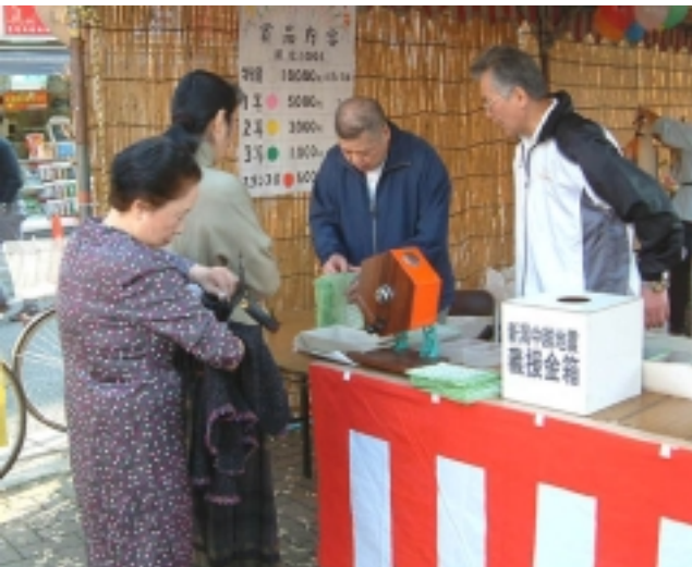
台紙抽選会。新潟地震義捐金募金も！ スタンブ台紙1冊で1回抽選でき、最低600円、最高1万円分の買い物券が当たる企画。午前11時〜午後4時、先着1000冊限りとしたが、2時頃には定数に達する人気。抽選会盛り上げ、スタンブ収集意欲促進を兼ね、11月1日からスタンブ3倍セールも実施した。 抽選所を兼ねた本部テントには新潟地震義捐金募金箱を設置、10円玉、1円玉が大半だったが4万円近く集まった

沢山。昨年までは南口広場のみを会場にしていたが、人が溢れるため、今年は北口広場や商店街内の数カ所に増やした。 事前の準備に動いた役員は10人近く。当日は朝7時に6人が集合、ジャンボ遊具の設置立ち会いなど最後の準備作業にとりかかった。交通整理担当