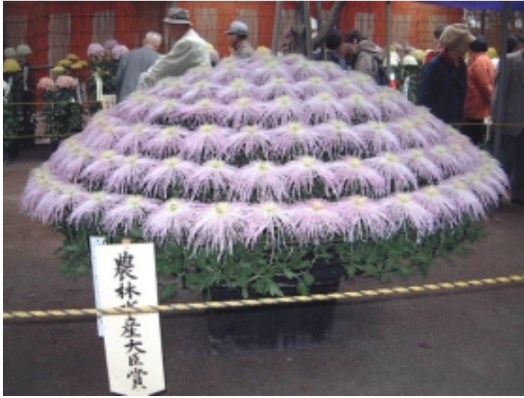
道路が予想以上にすいていたので、予定外だった川越・喜多院の菊祭りも見学できた