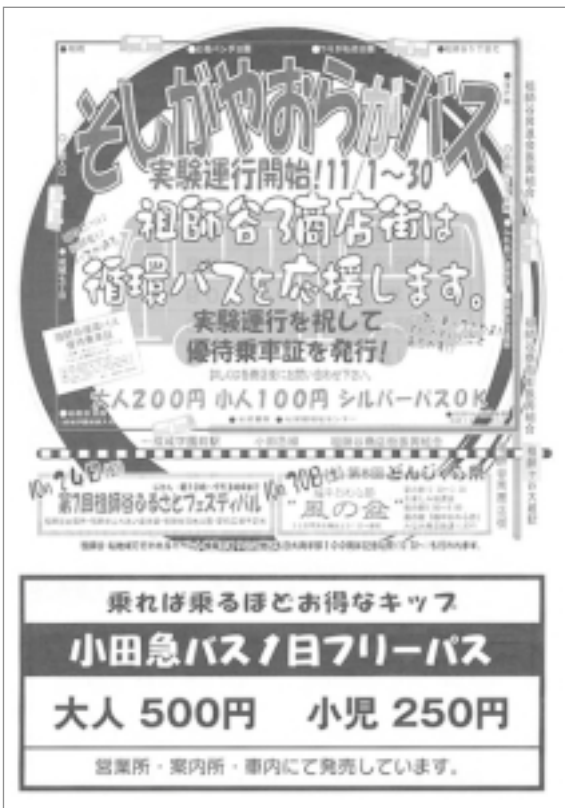
循環バスの運行をお知らせするチラシ裏面は時刻表

コースは、砧総合支所から成城7丁目まで。運行時間は、7～19時まで30分に1本。実験期間は11月1カ月。