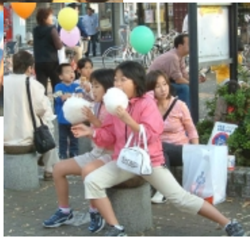
ワタアメおいしいぜ！ 小学校高学年ぐらいの子2人が元気いっぱい、ほおばっていた