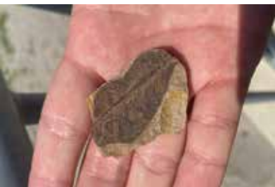
新潟市間瀬で見つけた葉化石