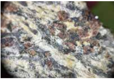
スリランカの地層に 大量に混入していたザクロ石