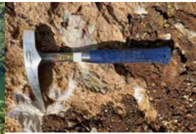
スリランカでの実習の様子