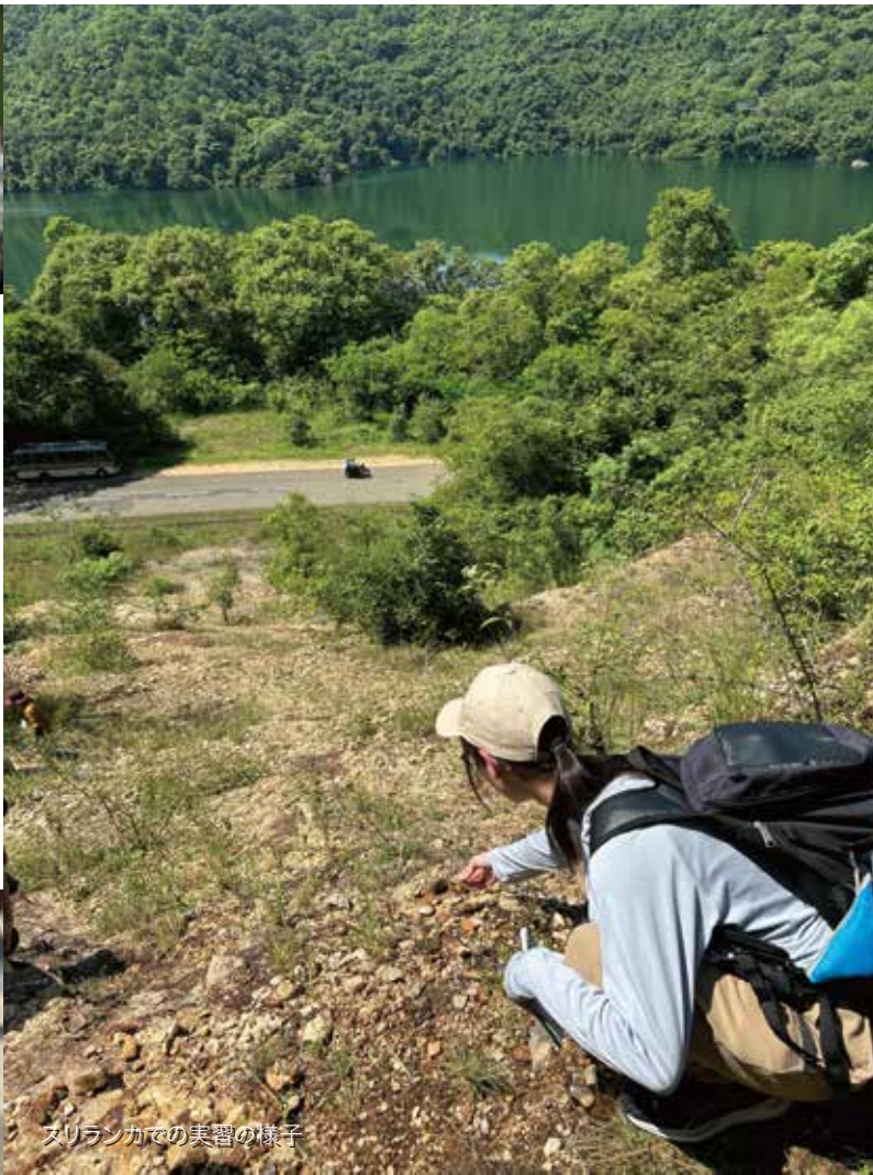
スリランカでの実習の様子