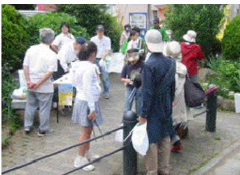
松陰神社通りのクリーン作戦風景

(注*)「せたがやせん沿線ポイント」は、イベント参加の7商店街で1枚50円の割引券として使えるほか、5枚で東急世田谷線せたまる回数券に20ポイント積み増しできる。