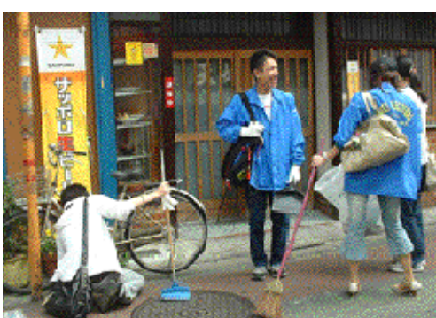
*クリーン作戦風景の写実はすべて、両商店街のHPから転載