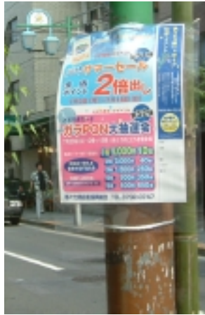
街路灯に取り付けた等々力振組のポスター

中里通りでは、同じデータをサイズを変えてポスターやチラシにする。チラシは、振組所有の軽印刷機で約6千枚を印刷、新聞折り込みにしている。等々力では、毎月1、2回、何らかのポイントサービスを実施しているが、その告知は殆どポスターで。掲示場所は商店街の街路灯88基。雨にぬれてもいようにラミネート加工する。そのため機械も3台購入、毎月の役員会でその作業をするという。