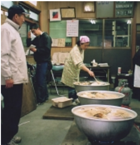
◀大鍋3つを動員してアク抜き