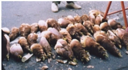
こんなに採れました