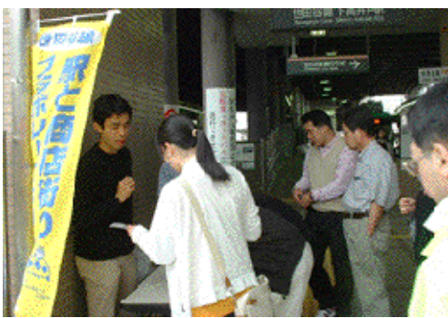
下高井戸のクリーン作戦風景

第2は、9月4日から、(1)スタンプ加盟店で買い物袋・エコバッグを利用して200円以上買い物をした消費者にスタンプ2枚とエコバッグ利用証を配付、(2)せたまとエコバッグ利用証スタンプ2枚をしもたかステーションに持参した消費者にスロットに挑戦してもらい、景品を進